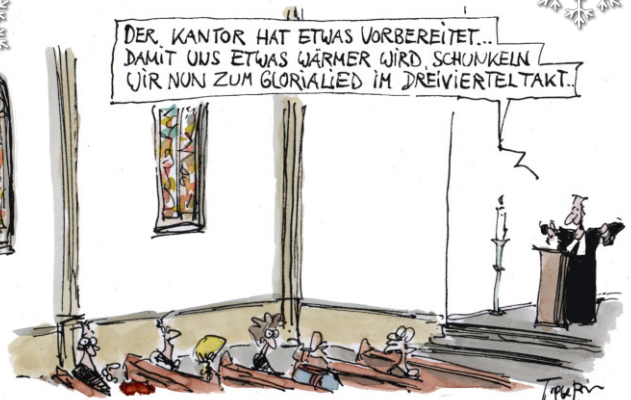
DER WINTER KOMT... ENERGIESPARBEWEGUNG

An den Sonntagen werden wir jeweils abwägen, ob wir den großen Gottesdienstraum heizen.